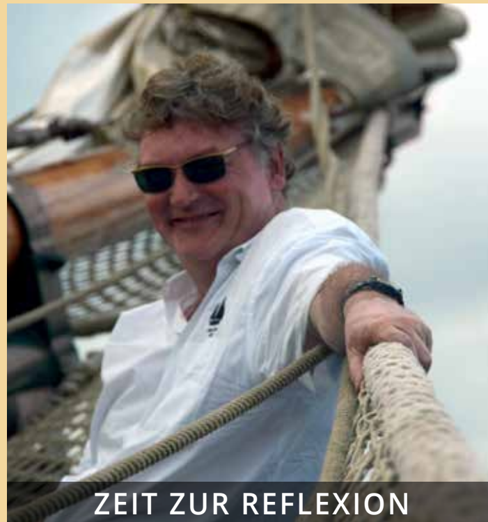
ZEIT ZUR REFLEXION