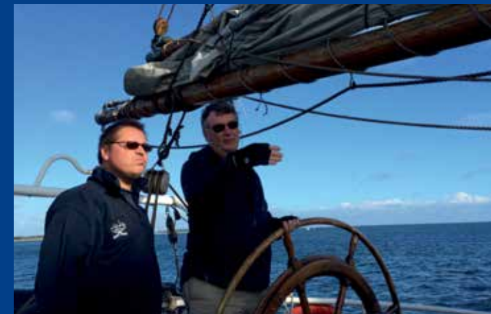
Kompetent Entscheidungen treffen