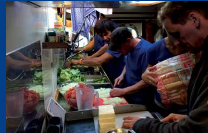
Service auf Gegenseitigkeit