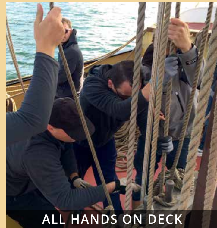
ALL HANDS ON DECK